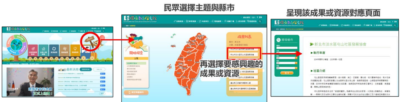
圖3、地圖探索使用 - 一般地圖探索

在探索環境教育相關資源過程中，若想要找尋本地或鄰近地區之相關資訊，或依照各縣市查看各種成果，可以透過點選首頁環境教育代言人「鴉博士」手上地圖探索牌子進入探索頁面，即可依照主題與縣市進行成果資源探索。