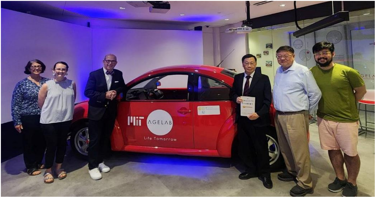
圖：亞大校長蔡進發（右 3）、亞大黃光彩講座教授（右 2），與 MIT AgeLab 年齡實驗室創辦人兼主任 Joseph F. Coughlin 教授（右 4）、AgeLab 團隊合影。