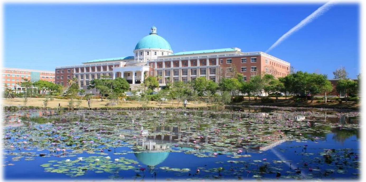
圖：就讀亞大，就是就讀一所「綜合大學」+「醫學大學」+「國際大學」